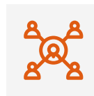
Trabajo en equipo