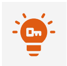
Resolución de problemas