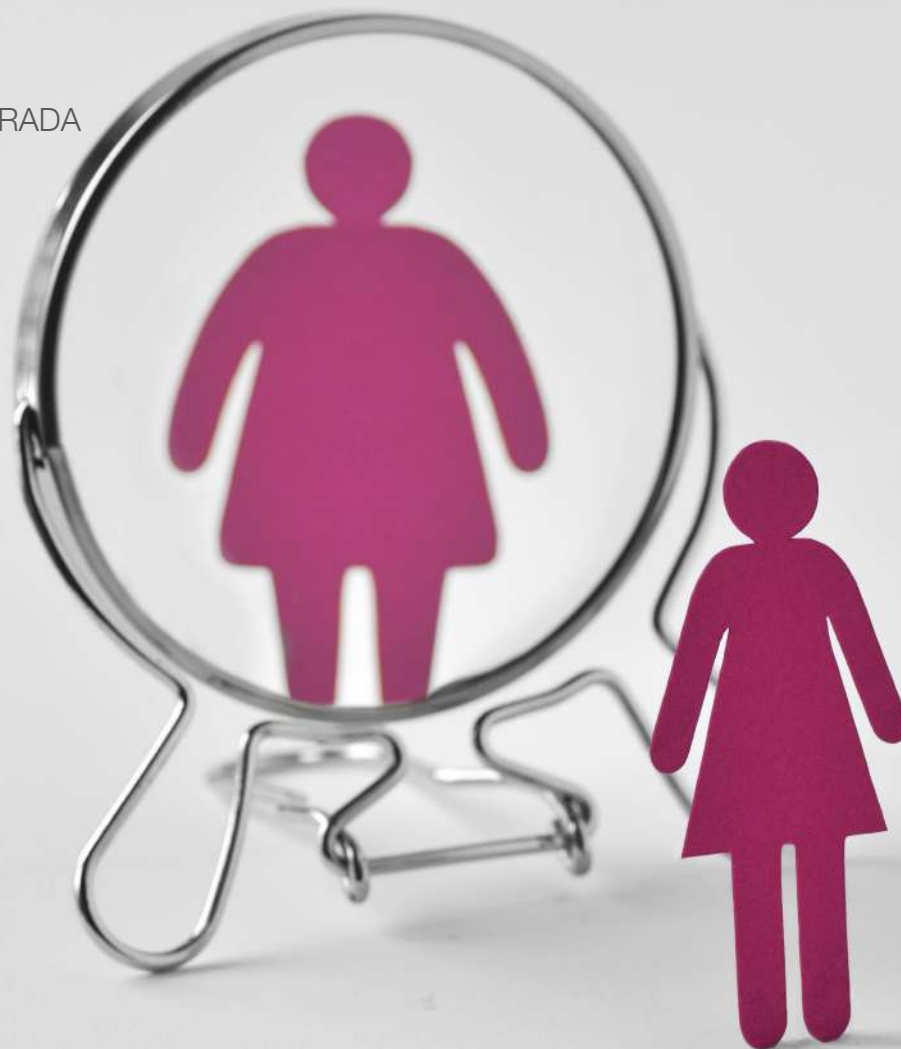
Imagen y autoestima: una lección en la publicidad