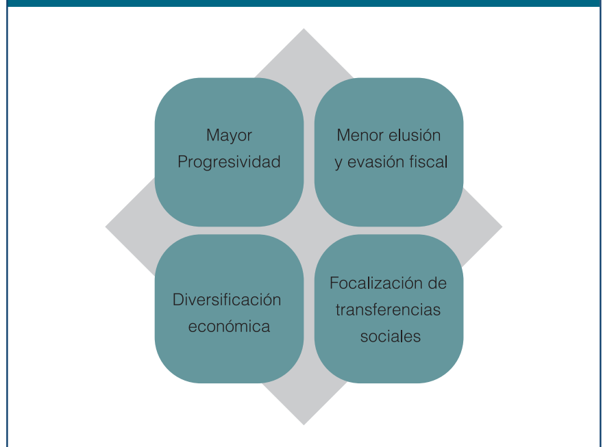
Gráfico 3. Principales cambios necesarios en materia fiscal de ALC

América Latina se enfrenta a un reto enorme en los próximos años. Aunque el camino no será fácil, la crisis actual puede ser una oportunidad para alcanzar consensos que permitan solucionar los problemas estructurales que arrastra. Esto es un requisito fundamental para poner en marcha reformas transformativas y políticas que ubiquen a la región en un camino de recuperación social y económica sostenible.