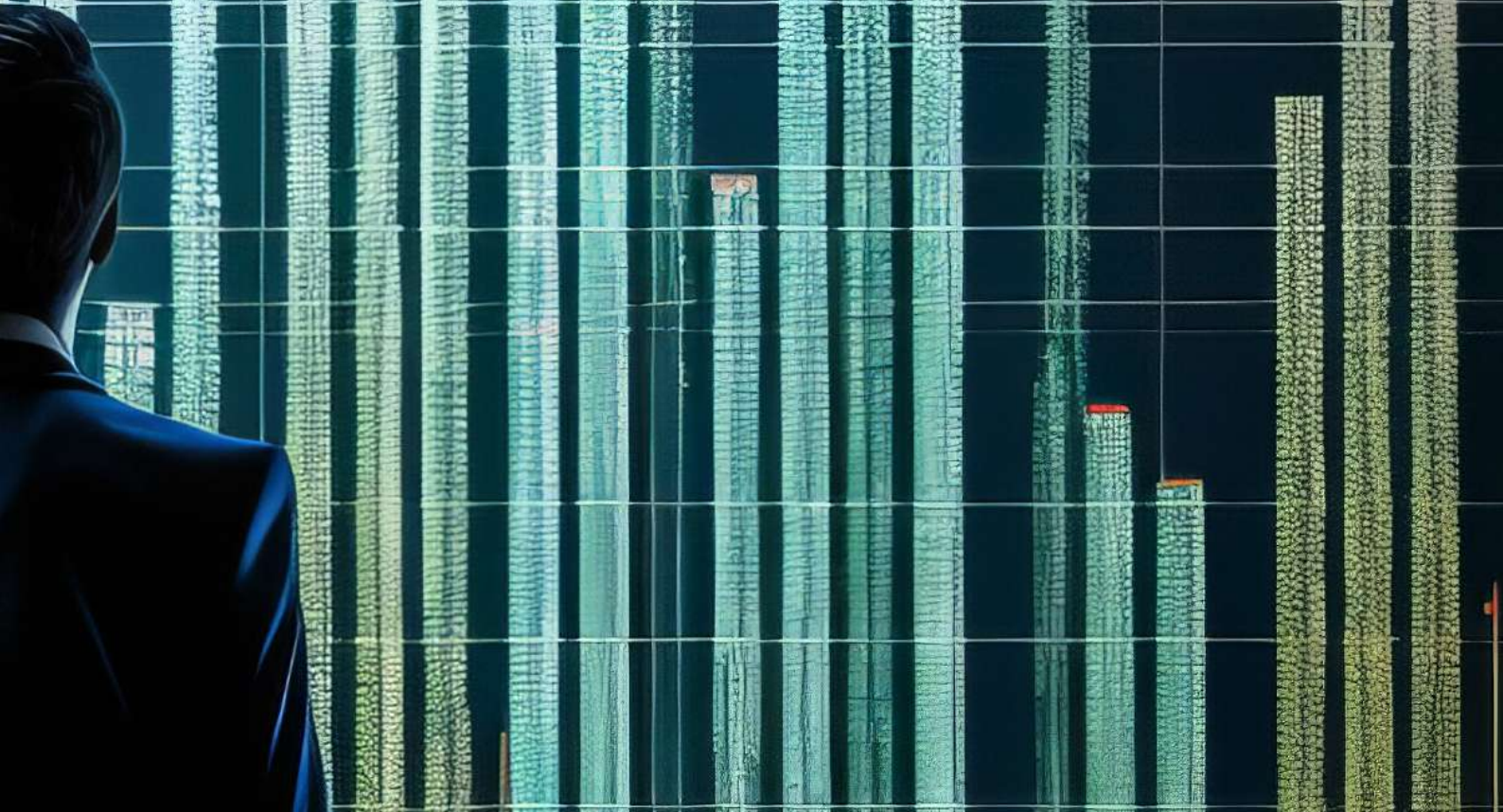
Gráfico 1. PIB Ecuador de los últimos años