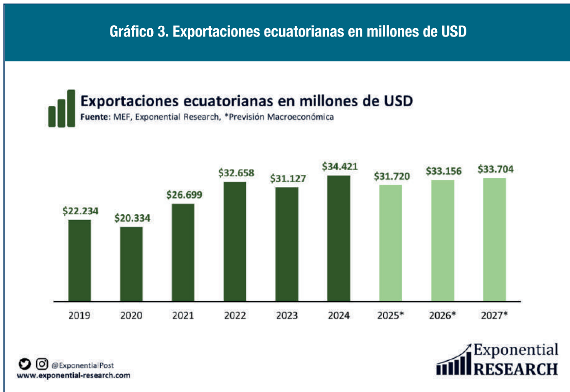
Gráfico 3. Exportaciones ecuatorianas en millones de USD